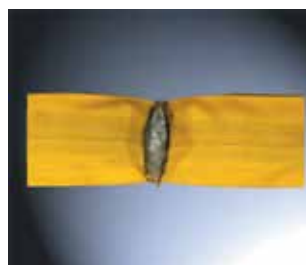
élingue ronde Duplix après 400 intervalles