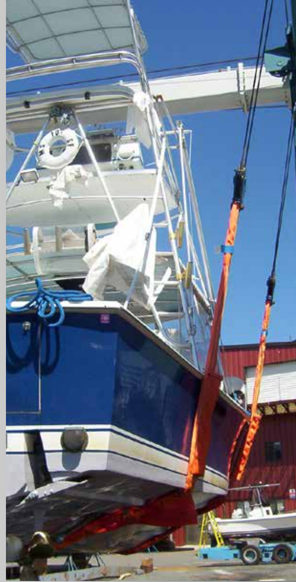
Élingue de levage DUPLIX pour bateaux