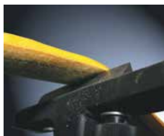
test abrasion de l'élingue ronde Duplix