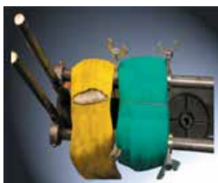
Comparaison entre élingue ronde Duplix et élingue ronde Duplix Inox après 300 intervalles