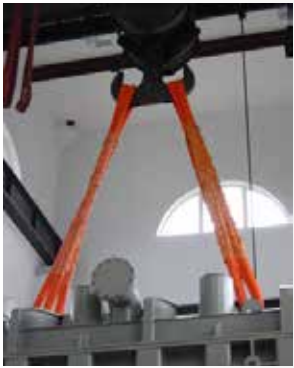
Élingue de levage DUPLIX